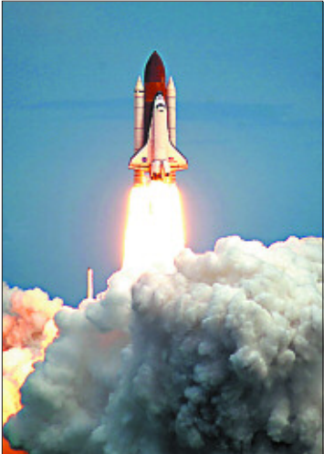
El Discovery despega.

La astronauta Pamela Melroy, es la comandante del transbordador espacial estadounidense Discovery , que partió ayer desde el Centro Espacial Kennedy hacia la Estación Espacial Internacional. Cuando atraque mañana el transbordador en la estación, Melroy se reunirá con Peggy Whitson, que desde el pasado día 19 es la nueva comandante de la base espacial. La nave transporta el nodo Harmony, que tiene tres camas , con lo que podrán vivir permanentemente seis personas en la estación. Allí también atracarán los módulos europeo y japonés. El astrona-